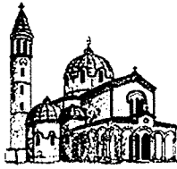
Santuario N.S. della Moretta