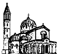
Santuario N.S. della Moretta